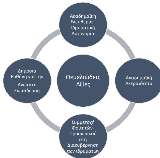
Σχήμα 1. Οι θεμελιώδεις αξίες

Οι Υπουργοί Παιδείας της Ευρωπαϊκής Ένωσης, κατά την υπογραφή της διακήρυξης της Μπολόνια τον Ιούνιο του 1999, δήλωσαν τη δέσμευσή τους στις αξίες της ακαδημαϊκής ελευθερίας και της ιδρυματικής αυτονομίας. Η δέσμευσή τους αυτή επικυρώθηκε σε επόμενα κοινά ανακοινωθέντα, σε συνδυασμό με την υπόσχεσή τους για μεταρρυθμίσεις στα συστήματα ανώτατης εκπαίδευσης των χωρών τους. Γνώμονας των μεταρρυθμίσεων ήταν οι αξίες αυτές, καθώς επίσης και η συμμετοχή των φοιτητών και του προσωπικού στη διακυβέρνηση των συστημάτων ανώτατης εκπαίδευσης και η δημόσια ευθύνη για την ανώτατη εκπαίδευση. Παρόλο που διαχρονικά έχουν αναγνωριστεί και άλλες αξίες ως εξίσου σημαντικές για την ανώτατη εκπαίδευση, όπως είναι η ισότιμη πρόσβαση, οι τέσσερις προαναφερθείσες αξίες, αποκαλούμενες και θεμελιώδεις αξίες αποτελούν τους βασικούς πυλώνες του Ευρωπαϊκού Χώρου Ανώτατης Εκπαίδευσης (Σχήμα 1).