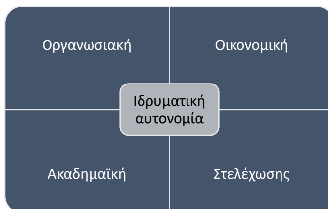
Σχήμα 3. Οι διαστάσεις της ιδρυματικής αυτονομίας κατά την ΕΥΑ